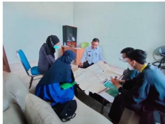
Gambar 3. Dokumentasi Kegiatan Pengabdian kepada Masyarakat