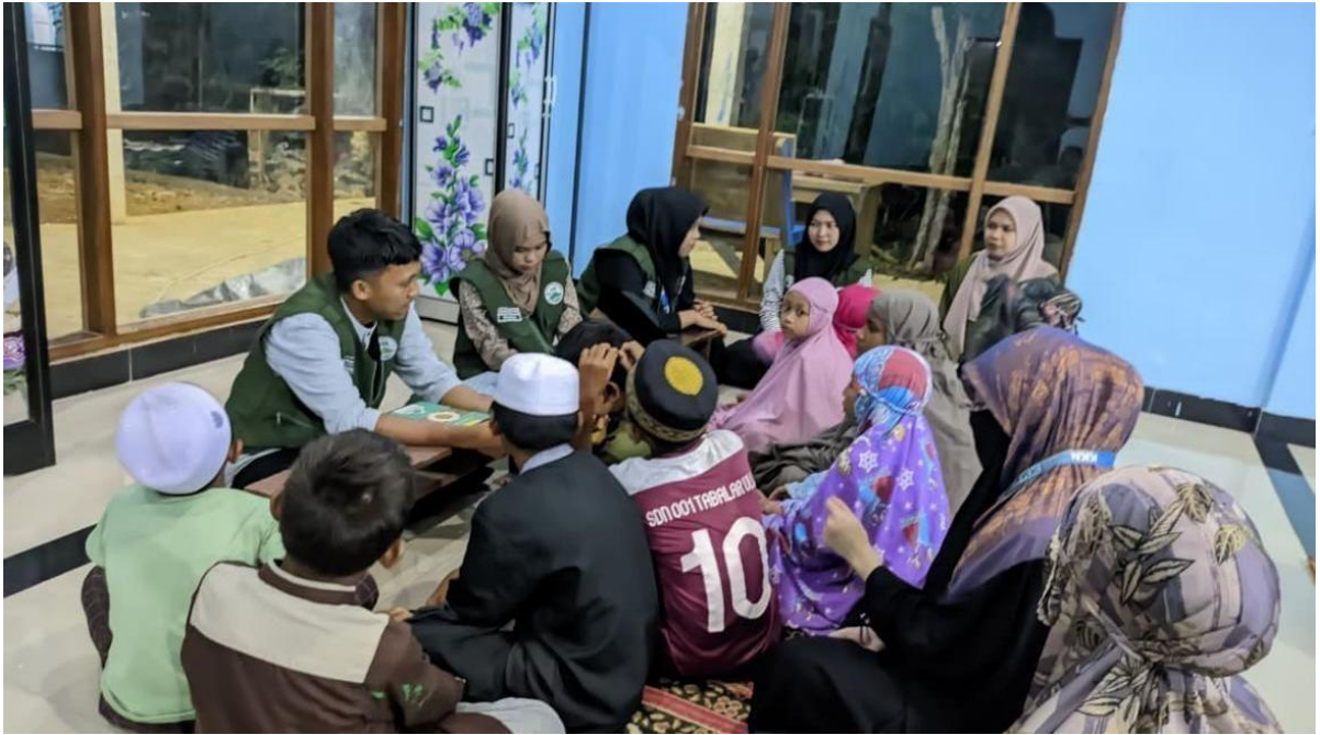
Gambar 4. Sesi Tanya Jawab Mengenai Doa – Doa Sehari hari