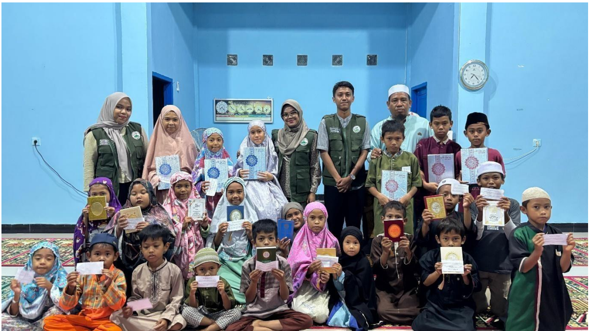
Gambar.5 Penyerahan Kitab Suci Al-Qur'an