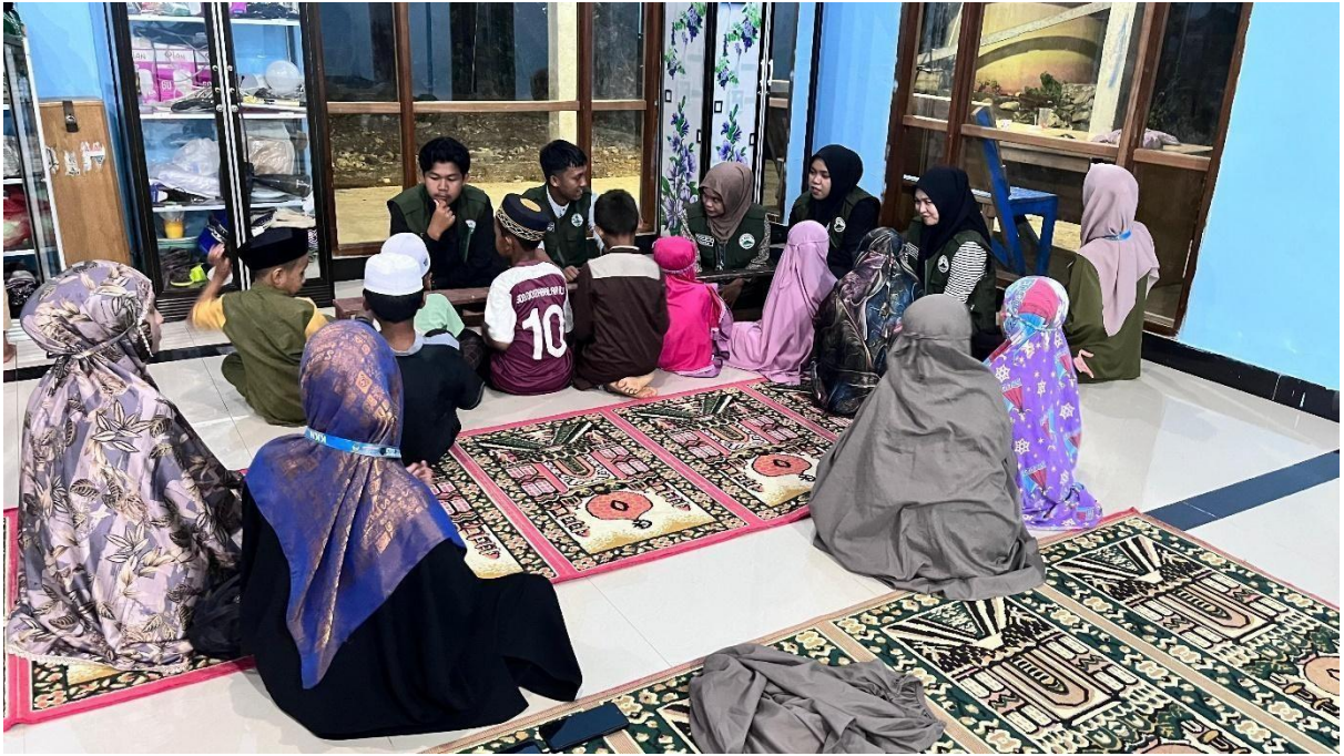
Gambar 2. Proses Mengajar Anak – Anak TPA