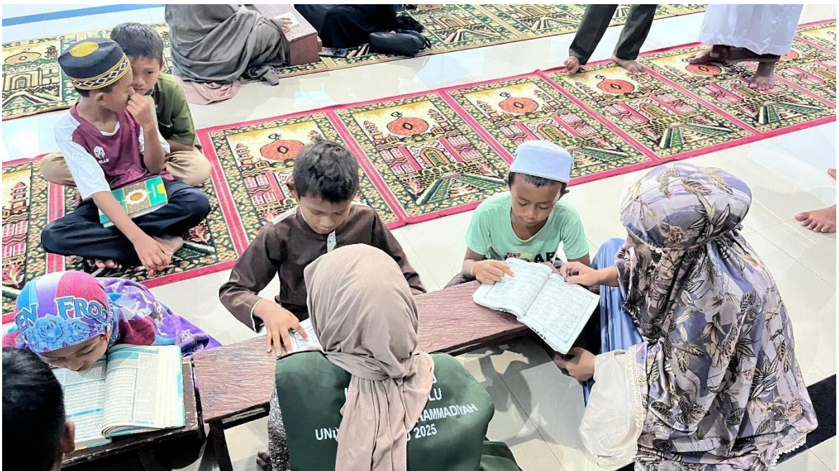
Gambar 3. Proses Mengajar Anak – Anak TPA